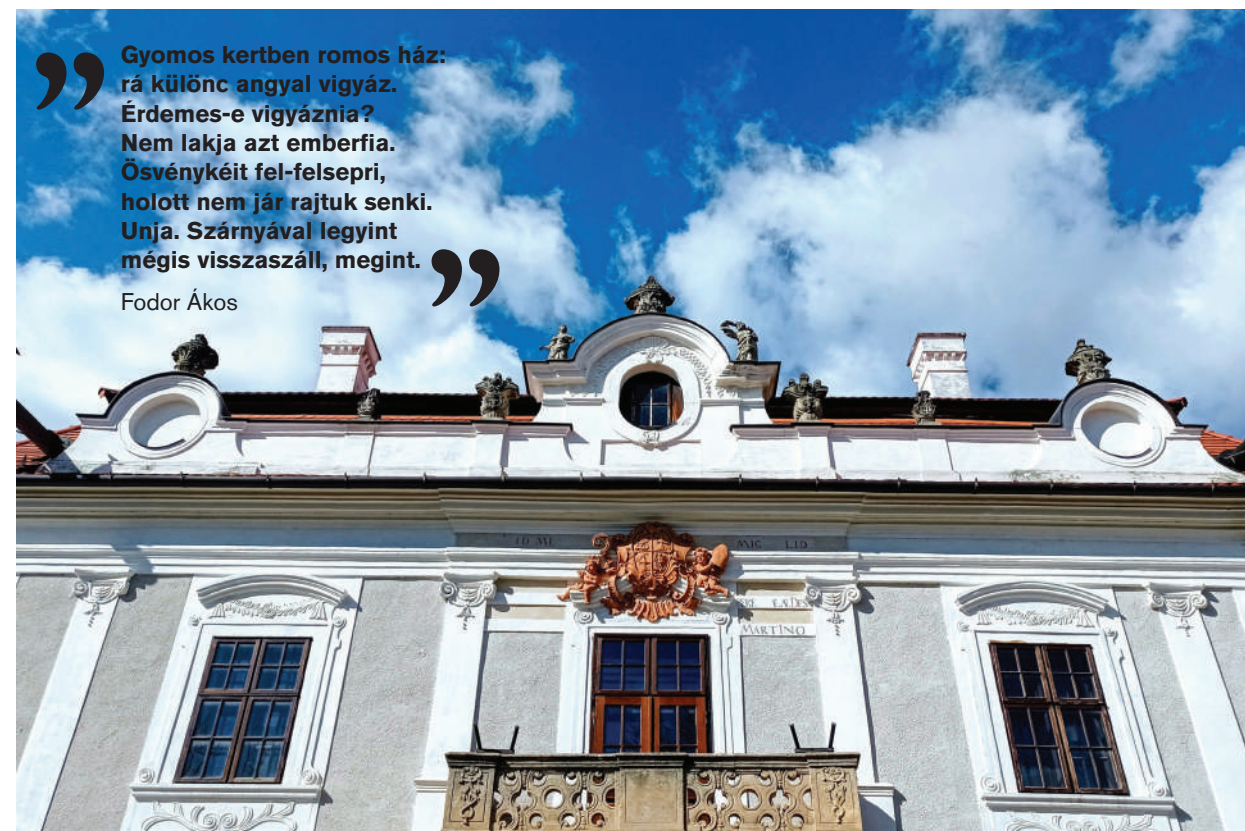
■ A palota főhomlokzata

2011 óta dolgozom a palotában, ami szinte a részemmé, sőt a családom részévé vált. Mondom ezt azért is, mert közel 10 éve nem voltam úgy nyaralni, hogy ne kellett volna a palota miatt hazaszaladnom. Ez nem panasz, hiszen ez egy szolgálat, mindenki, akinek része lehet egy műemléképület szolgálatában, különleges kitüntetésnek éli ezt meg. Rajtunk múlik, hogy a jövő generációja lát-e itt még valamit abból az örökségből, amit Padányi Bíró Márton püspök ránk hagyott. Úgy érzem, meg kell felelnünk az ő szellemiségének, ezért sem mindegy, hogy milyen tartalmak jelennek meg az épületben. Sokszor megkérdézném