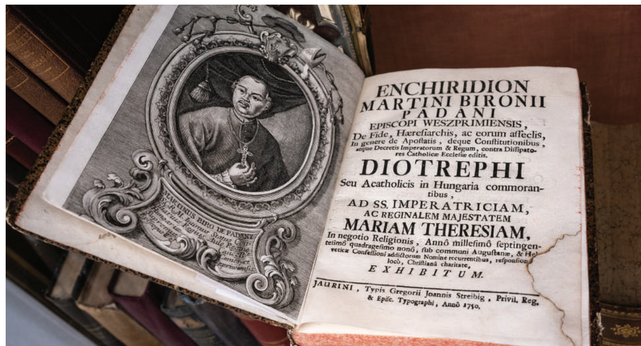
■ A kiállításban látható Padányi botrányos utóéletű főműve, az Enchiridion eredeti példánya

Recepciósként kezdtem el itt dolgozni, minden zegzugát megismertem a palotának, hiszen a jegyértékesítés mellett minden felmerülő feladatot elláttam. Fokozatosan elkezdtük időszaki