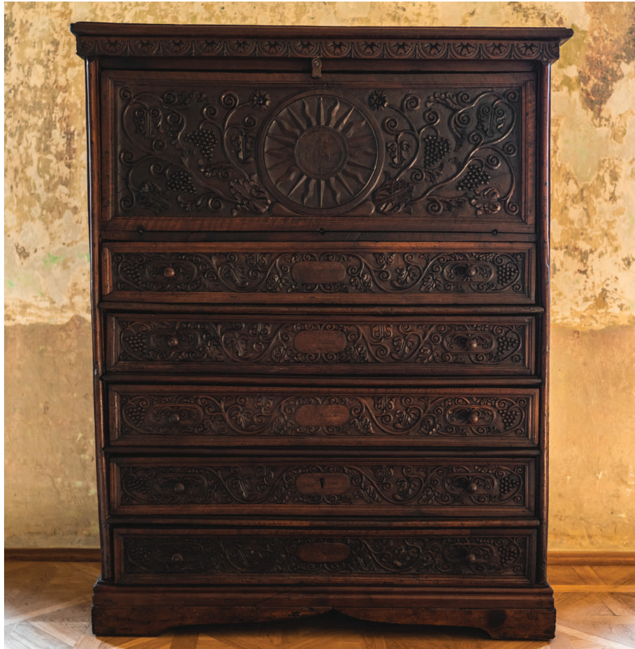
Restaurált sekrestyeszekrény a palotában

A dendrokronológia az egyetlen olyan kormeghatározási módszer, amely az évgyűrűk alapján képes évre pontosan megállapítani egy faanyag korát. A vizsgálati módszer elmélete Leonardo da Vincihez köthető, akinek naplójában utalás található arra, hogy a fák évgyűrűiről tudható a száraz és a csapadékos évek sorrendje. A régészet egyik legfontosabb datálási módszerét végül egy csillagász-fizikus professzor, dr. Andrew Ellicott Douglass dolgozta ki és ültette át a gyakorlatba. Douglass a saját szakterületén a napfolttevékenység földi hatásait tanulmányozta, amikor rájött, hogy ezek a ciklusok a földi időjárásra, így a fák évgyűrűire is hatást gyakorolnak. A vizsgálat azonban csak tölgy- vagy fenyőfán végezve ad hiteles információt, mivel ezekről áll rendelkezésre kellő mennyiségű feldolgozott adat.