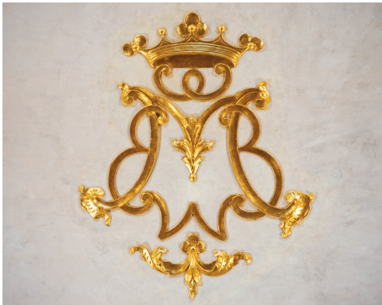
■ PBM (Padányi Biró Márton) monogram a könyvtárban

LECTUM ET DI/SCAM MANDA/TA TUA / PSALM: / 118 / VE. 7[3]” – „adj nekem értelmet, hogy megértsem parancsaid” (Zsolt. 119 [118], 73). A restaurátorok szorgos keze nyomán a mennyezet – amelynek közepén a csillogóan aranyozott PBM aranyozott monogram látható – újra éltre kelt. A helyreállított díszítésű püspöki könyvtárteremben ma nem csak szép, de izgalmas látvány tárul a látogató elé. Az itt felvultatott meghökkentő, virtuális eszközök célja, hogy bemutassák a barokk kor emberének gondolkodásmódját. Láttatni azt, hogy a korabeli íráskor alapján Padányi vagy hívei milyen képet alkothattak mennyről és poklóról, hogyan képzeltek el, hol helyezkedhetnek el ezek a világban.