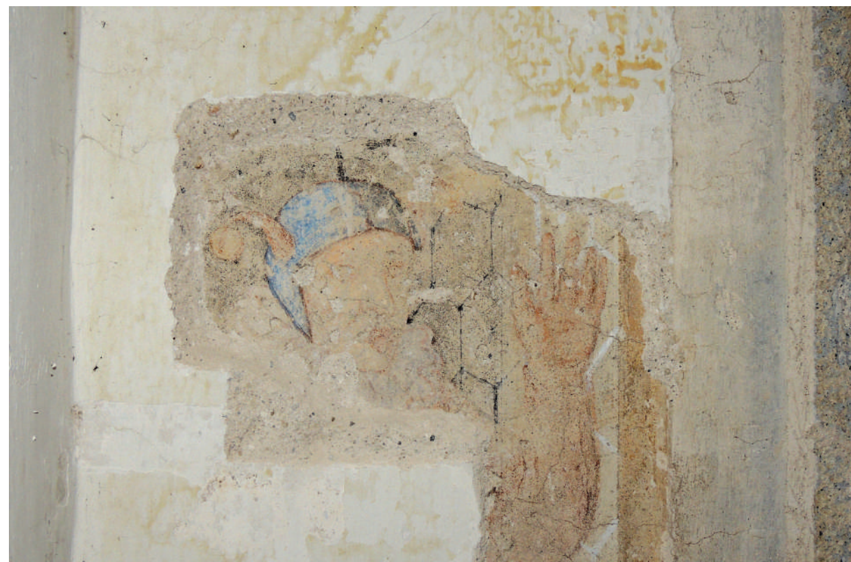
A palota különleges freskója

Padányi Bíró Márton már a plébániatemplom építése idején bővíthette a palota város felé, az egykori püspöki díszkertenéző homlokzatát a 18. században divatos hűsölőteremmel, az úgynevezett sala terrenával. A terem egykor mesés freskóit Franz Anton Maulbertsch nemzetközi hírnémet festő készítette. Nem csak a kertkapcsolat ilyen, szokatlan megoldása számított a korban divatosnak, a kifésztés tekintetében népszerű volt a „szemfényvesztés”: az alkotók ebben az időszakban előszeretettel festettek – megrendelőik kérésére – olyat, mint ha stukkót, vagy épp márványdíszítést látnánk a falakon, vagy