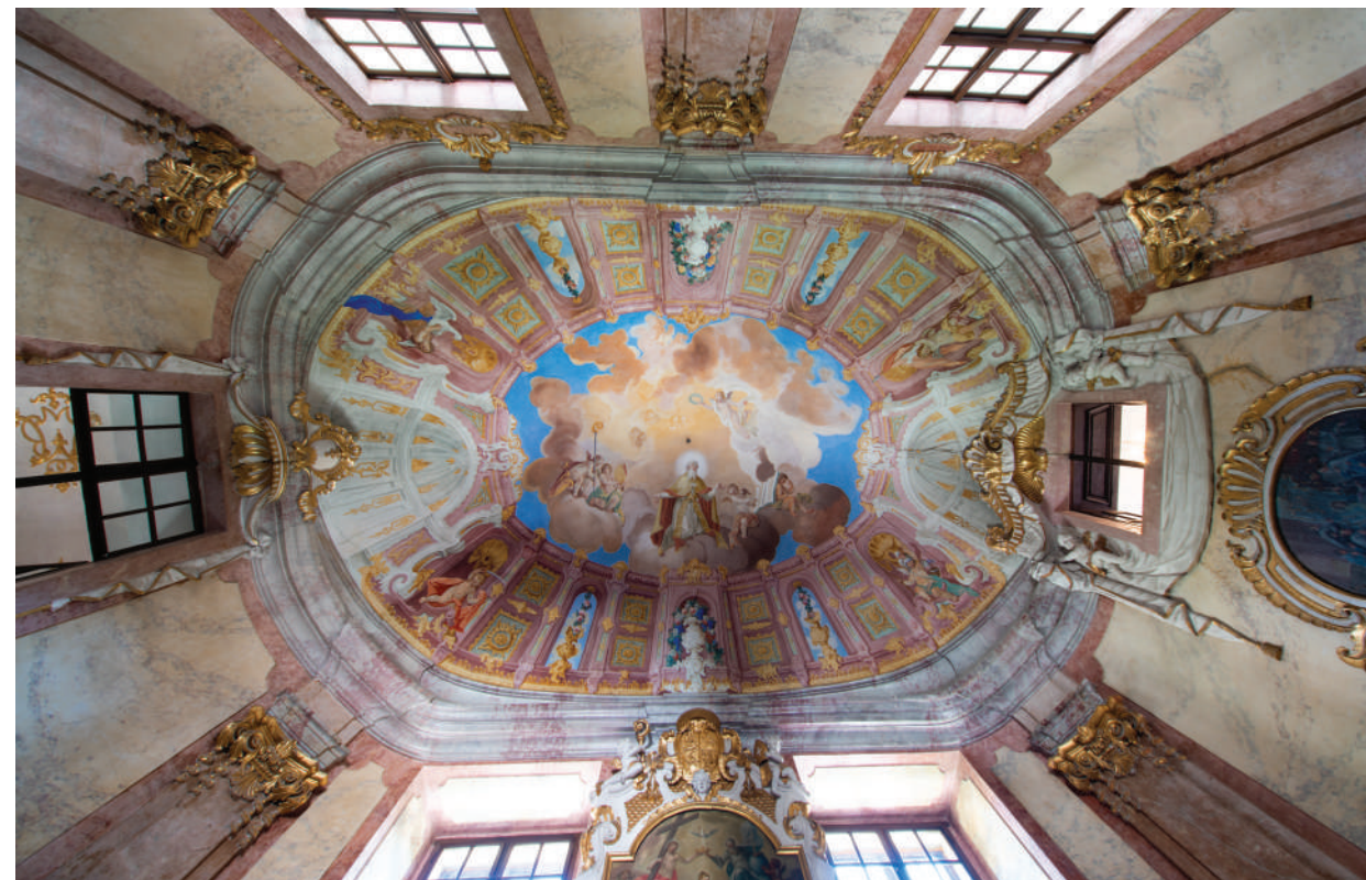
■ A palota kápolnájának mennyezeti freskója

Sümeghez való kötődésünk egészen régi. Művészettörténészként jó másfél évtizede foglalkozunk a környék barokk freskófestészetével, melynek kiemelkedő emléke a sümegi plébániatemplom Maulbertsch-freskója és a püspöki palota mára részben eltűnt freskódekorációja is. A palota legendás falképeiből csak kevés maradt meg, azonban a töredékekből is sok minden kiolvasható. Ezek után a rejtélyek után nyomoztunk, amikor elkezdődött a palota komplex felújításának megtervezése. 2015 óta vettünk részt a tervezésben. Különleges helyzet volt ez, mert műemlékvédelmi szakértőként az épület helyreállítását és a restaurálási munkákat összefüggésben kezelhettük a turisztikai fejlesztéssel, amit a leendő kiállítás kurátoraiént mi határoztunk meg. Sümeg és a palota adottságaiból következett, hogy a kiállítás fő témája a freskófestészet, a palota építetője, Padányi Biró Márton püspök nagy műve lett. Ezt