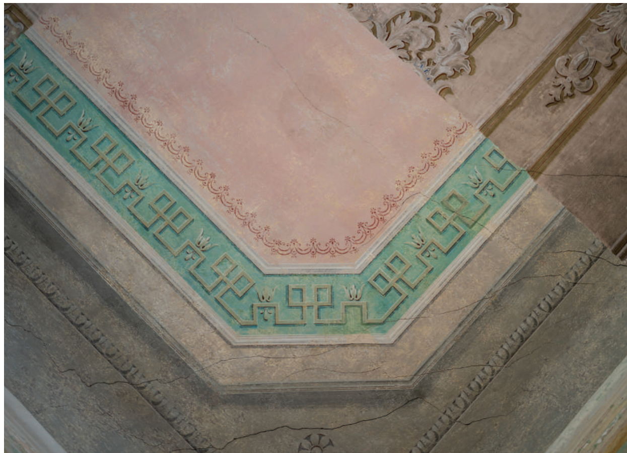
■ Freskórészletek a palota különböző korszakaiból

A kiváló festőrestaurátori tevékenységnek köszönhetően értékes falképek, továbbá számos freskó került restaurálásra, feltárára a palota egyes korszakaiból. Így láthatóvá váltak a barokk, a klasszicista, néhol még a 20. századi eleji részletek is. Különböző korok vizuális lenyomatait figyelhetők meg az egyes helyiségekben. Különféle szintű és rangú festőművészek, illetve lelkes amatőrök is elhelyezték kézjegyüket a palota falain. A művészien megkomponált freskók mellett a graffittal készített figurák, vagy épp a korommal rajzolt halálfejek megőrzése egyaránt fontos volt a restaurátorok számára, hiszen ezek mindegyike egy-egy korszak titkos történetét őrzi.