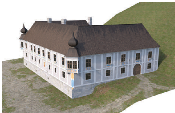
A püspöki palota a 18. század első felében. A grafikát a Pazirik Kft. készítette.

szárnyában megmaradt egytraktusos, emeletes és alapincézett épületrésszel azonos. Több eredeti részlete, ablakai, homlokzata, földszinti dongaboltozata máig látható. A 17–18. század fordulóján az épületet U alaprajzúra bővítették. A várhegy tövében álló, az udvar felé íves tornáccal megnyíló, emeletes kúria különlegessége egy csalókan megfestett vakablak, amelyben egy nyelvét kiöltő, csörgősípkás bolond áll és integet kifelé. A birtokközpontként szolgáló püspöki kúriában kocsmá és bolt is működött.